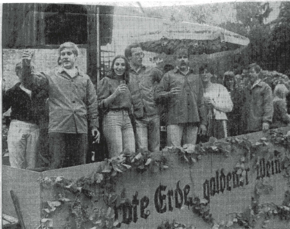
Die Kerwe-Umzüge im „Fröhlichen Weinberg“ werden von Jahr zu Jahr stimmungsvoller und attraktiver. Unser Bild zeigt einen Wagen vom vergangenen Jahr, mit dem für den goldenen Wein sowie die rote Erde geworben wurde.